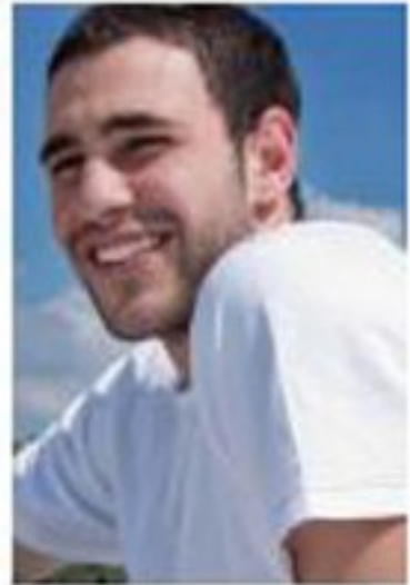
Figure A.2. Facial Picture 2.