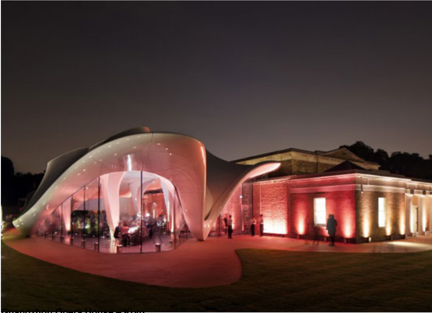
Guangzhou Opera House – Kiva