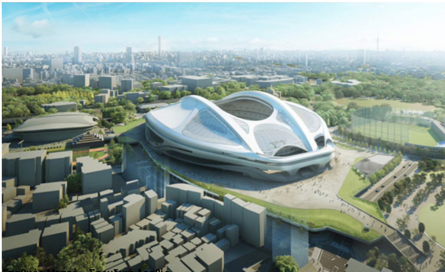
Σταθμός Μετρό – Σαουδική Αραβία